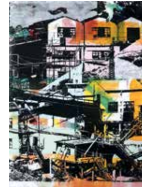
Es ist still in Monte Vecchio (Sardinien)

Das Versetzen und Entnehmen verschiedener existierender Situationen, um sie an einem anderen Standort anders und neu zusammenzufügen, gehört zu meiner Arbeitsweise. Daraus ergeben sich neue Wahrnehmungsebenen, die es in Wirklichkeit gar nicht gibt.