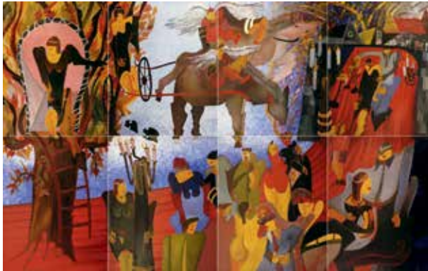
Le Rêve, 1998