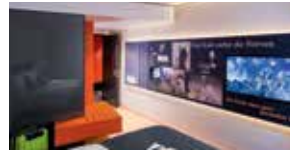
Künstler: Franz Hohler (Comfort Style)