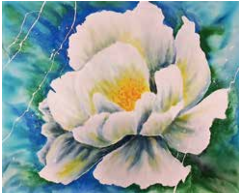
Pfingstrose Weiss, 2017