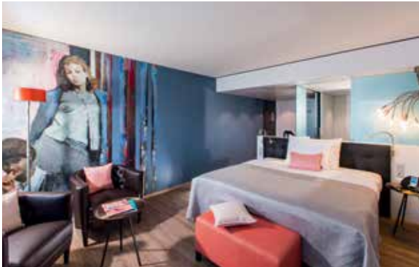
Künstler: Christoph R. Aerni (Arte Style)