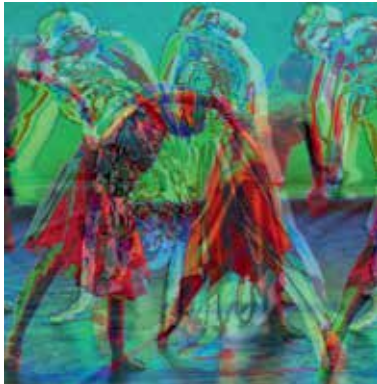
Auseinander – zueinander, 2008